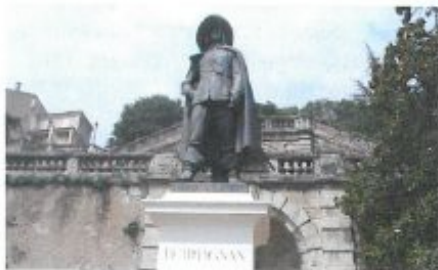
D'Artagan à Auch