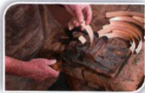
Musée de la Boissellerie – Bois d'Amont

Départ après le petit déjeuner. Retour par le même itinéraire. Déjeuner au restaurant en cours de route. Arrivée en fin de journée dans notre région.