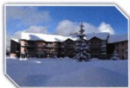
Village Vacances « Le Mont Fier » à Prémanon

10, allée de la Boulaye • 49110 Saint-Pierre-Montlambert Tél. 02 41 56 61 36 • fouchetravel@fouche-travel.fr