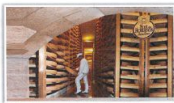
Cave d'affinage de Comté - Fort des Rousses